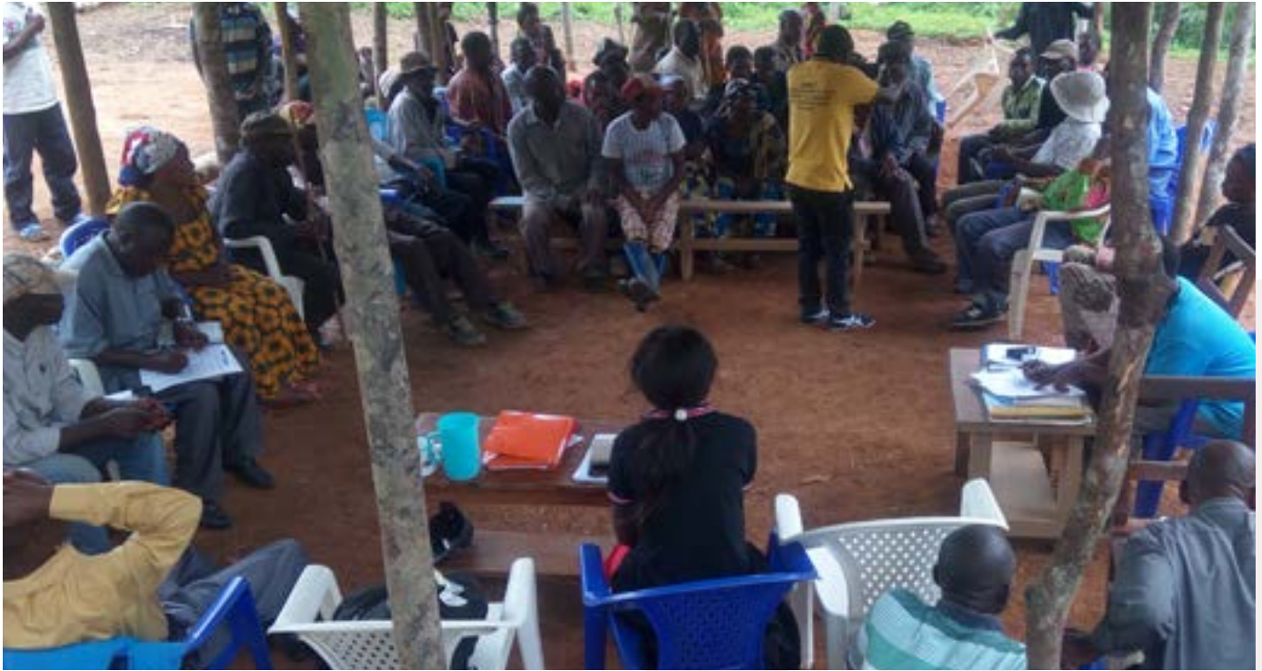
Les Peuples autochtones du territoire de Mambasa en atelier de formation des enquêteurs locaux dans le cadre d'une étude socio-économique

position produite pour la prise en compte des droits fonciers des peuples autochtones pygmées dans la politique foncière en cours de validation.