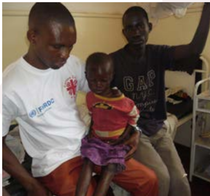
Un enfant malnutri aiguë sévère pris en charge dans l'hôpital général de référence de CIMENKAT / ZS LUBUDI