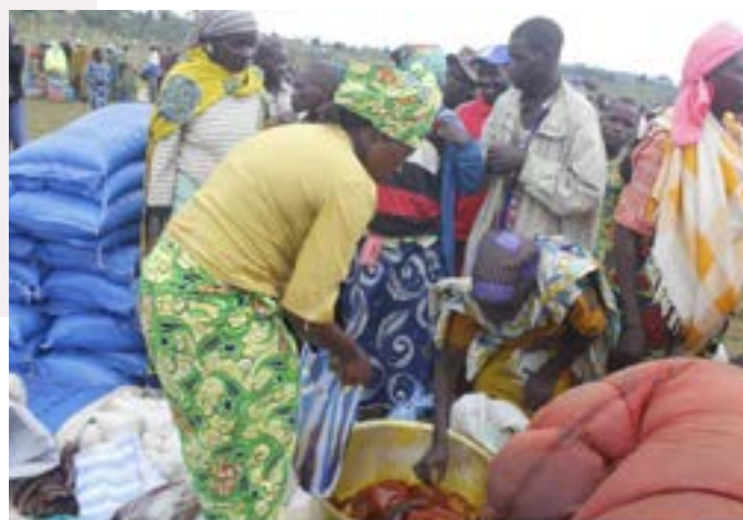
Des déplacés de Djugu recevant l'aide de Caritas

Au cours de cette année 2018, les activités sur projet ont été étendues au Territoire de Yakoma dans le Diocèse de Molegbe et ont consisté en la distribution des semences vivrières, des outils aratoires, des intrants de pêche aux réfugiés centrafricains et aux membres de communauté d'accueil les plus vulnérables. Les 4894 ménages bénéficiaires ciblés ont également reçu des conseils techniques en agriculture et en techniques de pêche et bénéficié d'un accompagnement rapproché pour les aider à améliorer la productivité de leurs activités.