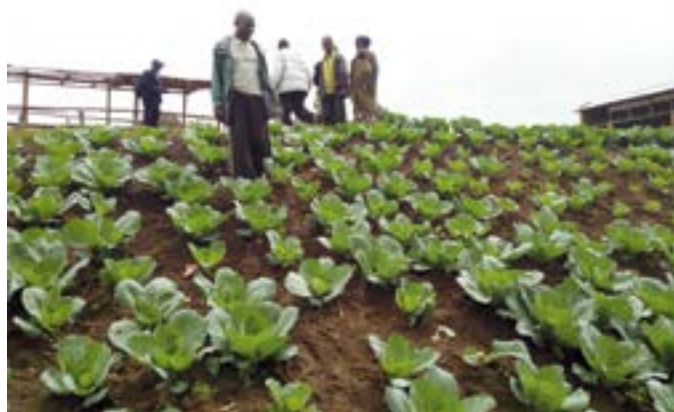
Les activités maraîchères pour soutenir la scolarisation des enfants