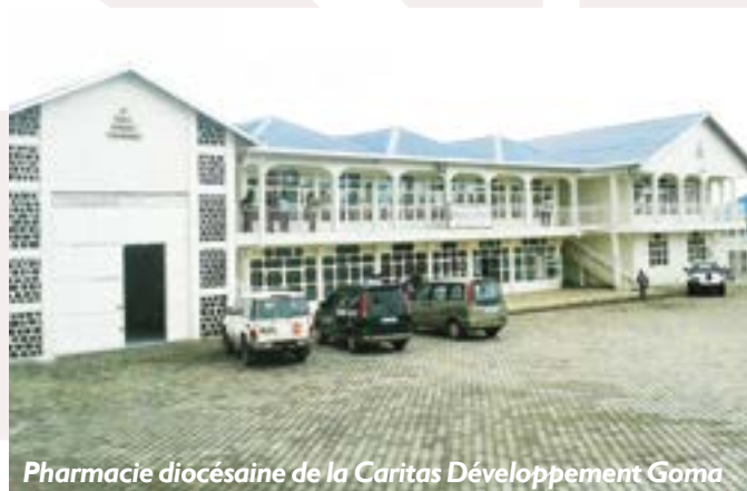
Pharmacie diocésaine de la Caritas Développement Goma

Faute d'appui financier institutionnel au réseau SPS/BDOM, la rencontre qui regroupe chaque année les BDOM autour du SPS, n'a pas pu être organisée : néanmoins, la province ecclésiastique de Lubumbashi a organisé sa rencontre provinciale avec ses BDOM membres.