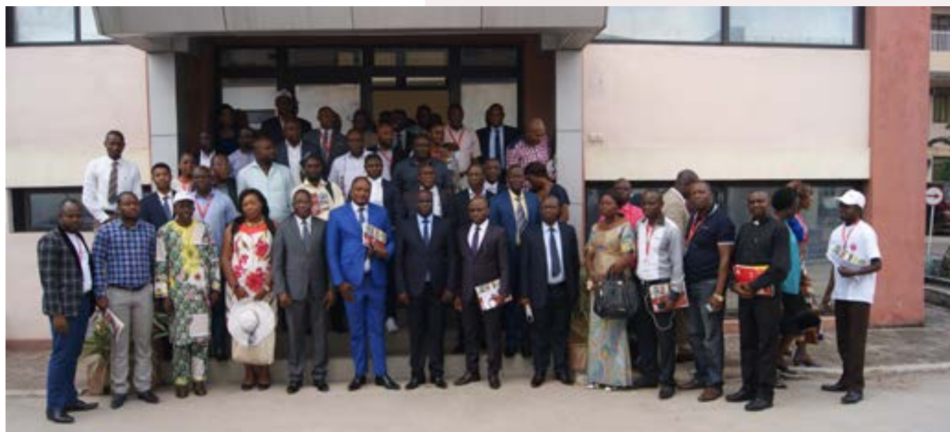
Quelques participants à la présentation du Rapport annuel 2017 de la Caritas Congo Asbl

Pour accomplir sa mission, le Réseau Caritas Congo Asbl possède de biens nombreux (bureaux, meubles, centres d'accueil, fermes agricoles, charroi automobile, mini-barrages, usines et équipements divers), même dans les coins les plus reculés du pays.