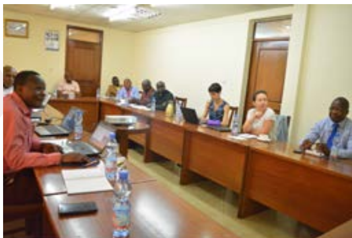
Vue des participants à la séance de travail entre le Staff de la Caritas Congo ASBL et une délégation de Caritas Espagne