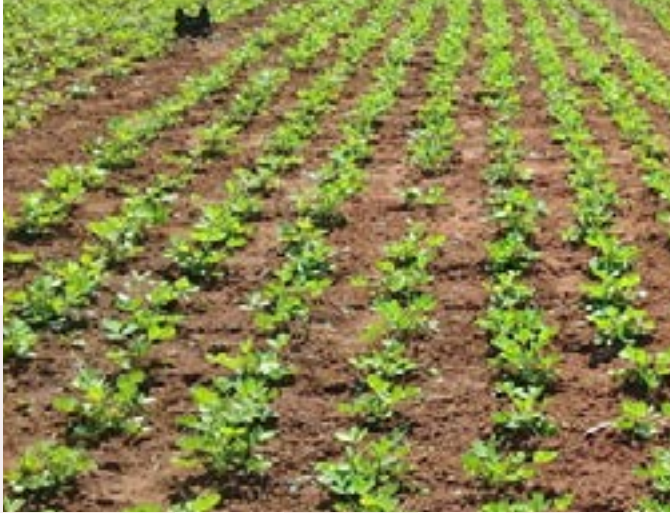
Apprentissage d'une parcelle de démonstration d'arachide dans le champs d'un bénéficiaire à Boketa dans le territoire de Gemena.