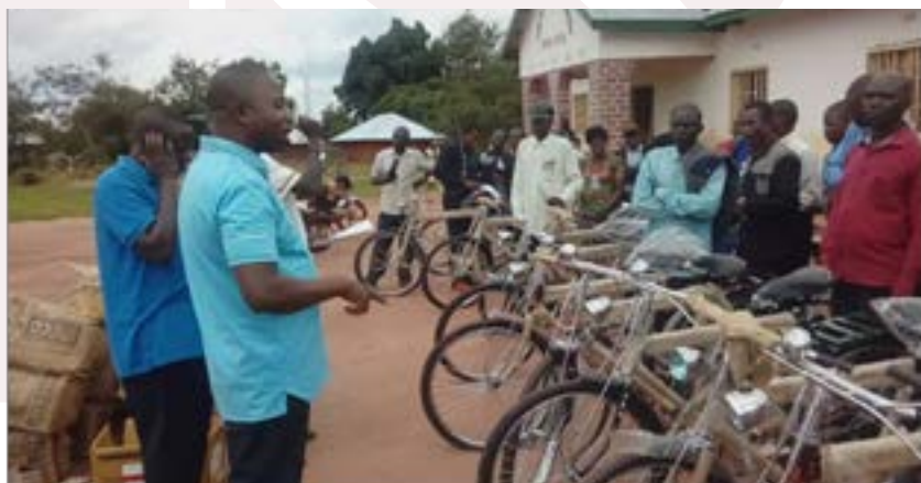
Remise des vélos aux Relais communautaires par le Médecin Chef de zone de Kabongo