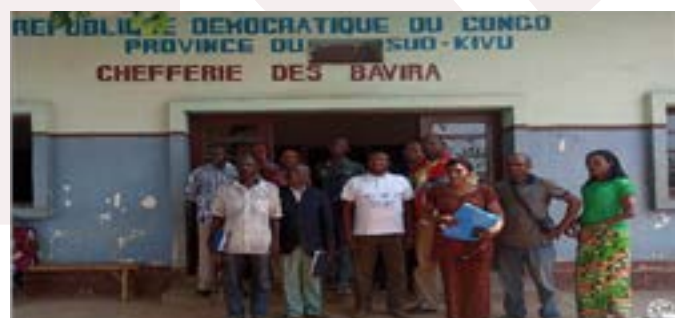
Séance d'échanges sur les effets du projet entre la délégation de la Caritas Congo Asbl, la Caritas Uvira, le staff de la Chefferie de Bavira ainsi que le Chef de Bavira

Les principaux résultats suivants ont été atteints en 2018 :