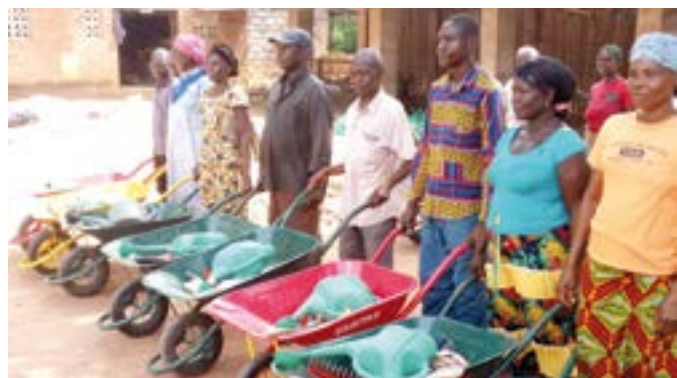
Des réfugiés centrafricains et familles d'accueil appuyés en sécurité alimentaire à Bili

maraiânières (gombo, amarante et morelle) et des outils aratoires, soit au total 870 ménages qui ont bénéficié de l'assistance.