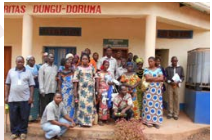
Renforcement des capacités des Caritas paroissiales par la Caritas Dungu-Doruma