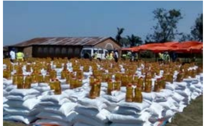
Aide de la Caritas-Développement Kananga aux sinistrés

D'autres réalisations inscrites dans ce rapport touchent des activités visant le renforcement du