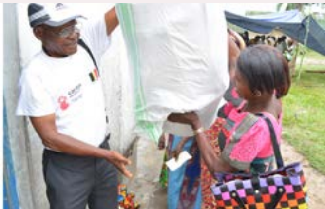
Aide d'urgence de la Caritas Mweka aux victimes des affrontements intercommunautaires à Kakenge.

Réseau Caritas en RDC, dans l'optique du premier axe de son Plan Stratégique.