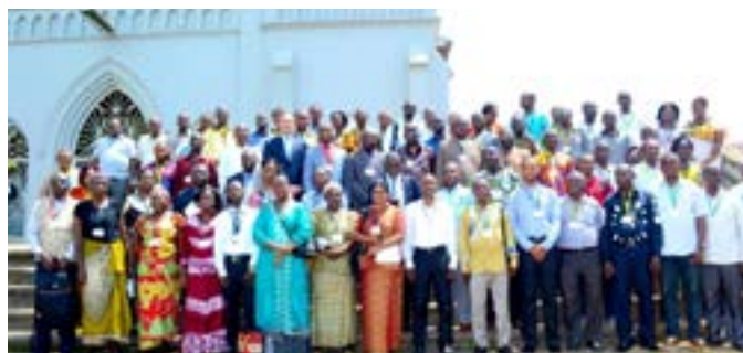
Des leaders religieux et les prestataires ayant participé à la formation sur l'engagement des confessions religieuses dans la lutte contre le VIH pédiatrique