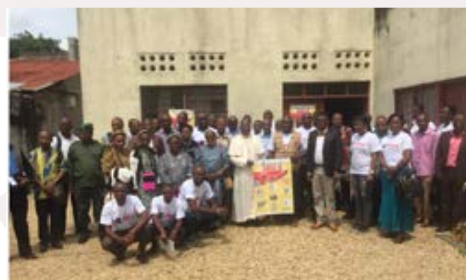
Le Secrétaire Exécutif de Caritas Congo Asbl et son Point Focal posant avec l'Archevêque de Kisangani et différentes parties prenantes après une journée de sensibilisation contre Ebola à Kisangani

A l'instar de l'action entreprise dans l'Archidiocèse de Mbandaka-Bikoro, un appui rapproché a été assuré aux Caritas diocésaines de Butembo-Beni, Bunia, Wamba et Kisangani qui ont été confrontées à l'épidémie de la Maladie à Virus Ebola peu de temps après la fin de celle de l'Equateur. Cette action soutenue en premier lieu par CAFOD a reçu également la contribution d'autres acteurs, notamment TROCAIRE pour les Diocèses de Wamba et de Bunia, et de l'UNICEF pour les 4 diocèses concernés. L'extension inattendue de l'épidémie due essentiellement à la résistance communautaire à l'application des mesures d'hygiène et la prévalence de l'insécurité a nécessité un engagement de tout instant et de longue durée (6 mois) de notre part malgré un risque important pour le personnel déployé dans la zone.